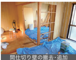
間仕切り壁の撤去・追加