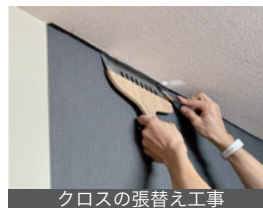
クロスの張替え工事