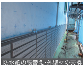
防水紙の張替え・外壁材の交換