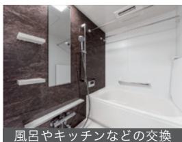
風呂やキッチンなどの交換