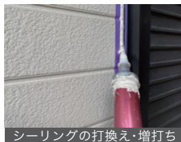
シーリングの打換え・増打ち