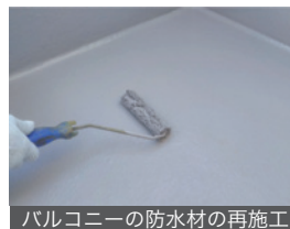
バルコニーの防水材の再施工