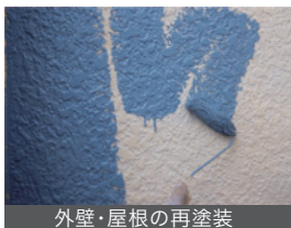
外壁・屋根の再塗装