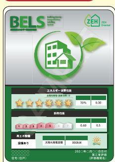
B5, B6, A6 サイズ