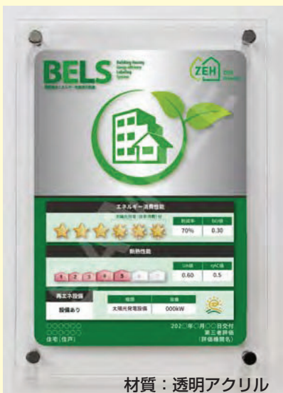
材質：透明アクリル