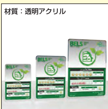
材質：透明アクリル