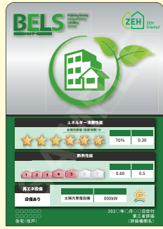
B5, B6, A6 サイズ